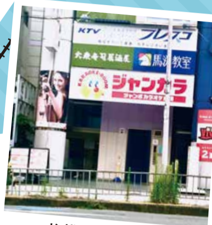
柱横の階段を直進