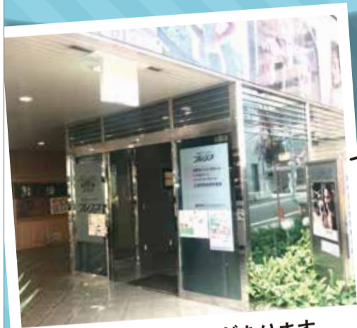
中にエレベーターがあります