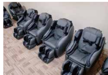
運動無しでも1日の体の疲れを癒してください