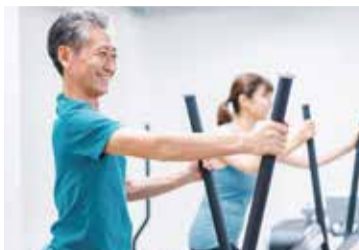
正しい筋トレで筋力アップ♪