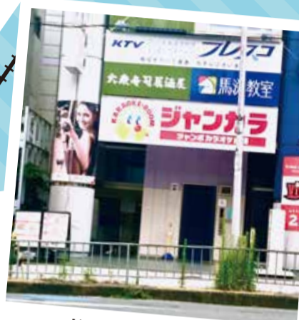
柱横の階段を直進