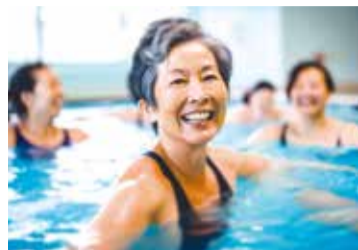
足腰に負担のない水中で鍛えましょう!