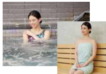
大きなお風呂・サウナで体と心をリフレッシュ