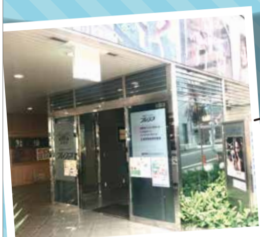
中にエレベーターがあります