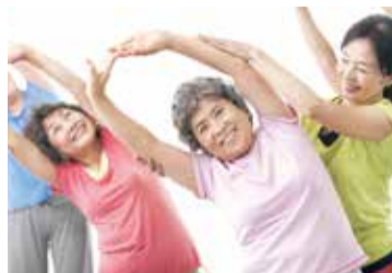
みんなで楽しく有酸素運動!