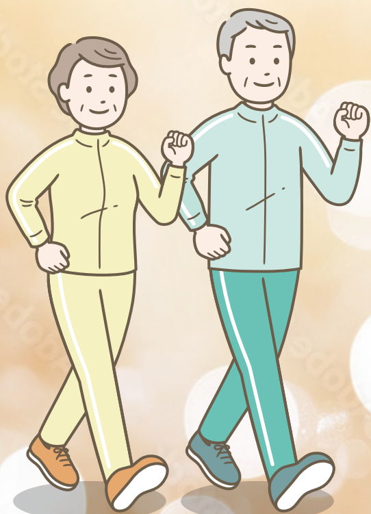
作家・エッセイスト 阿川 佐和子さん