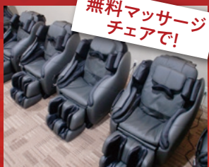
無料マッサージ チェアで!