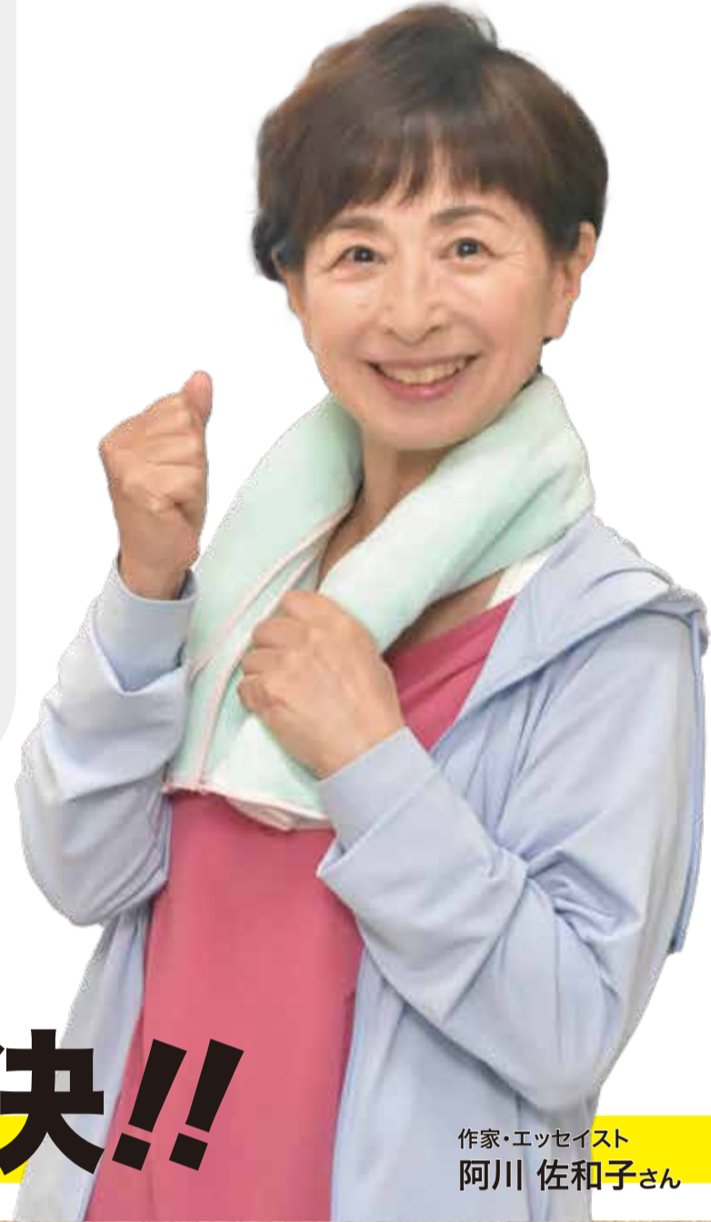
作家・エッセイスト 阿川 佐和子さん