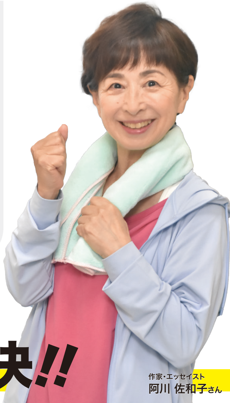
作家・エッセイスト 阿川 佐和子さん