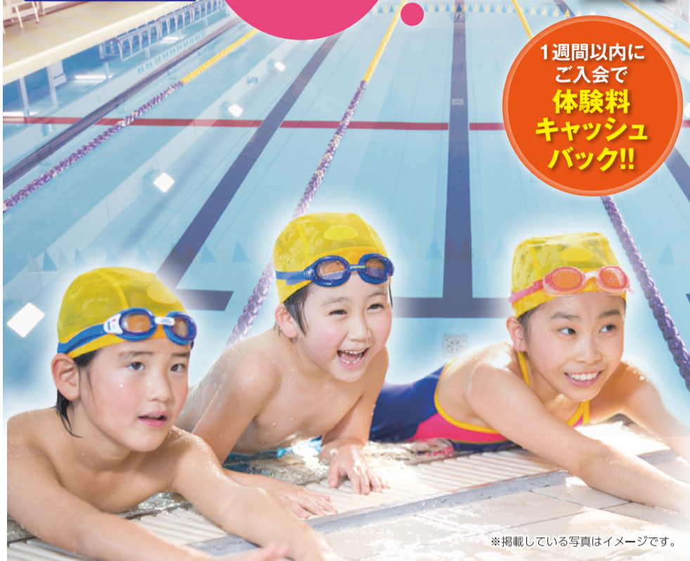
※掲載している写真はイメージです。