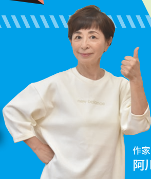
作家・エッセイスト 阿川 佐和子さん