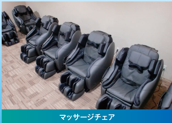
マッサージチェア